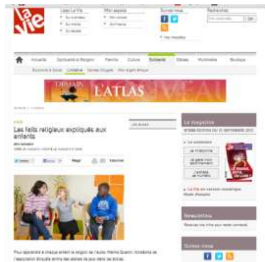
La Vie (bi-média, parution simultanée dans l'hebdomadaire et sur le site internet), 14 février 2013