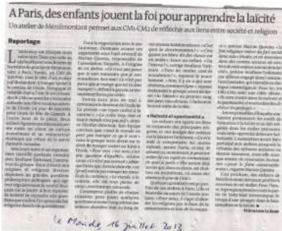
Le Monde, 16 juillet 2013